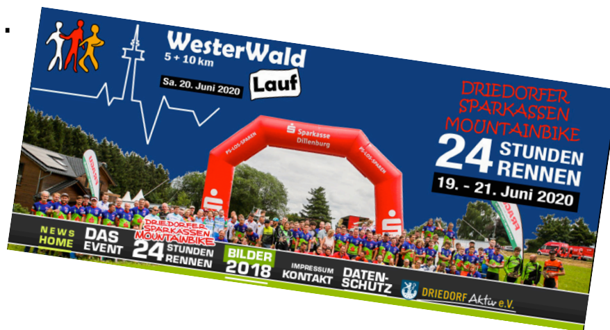
Screenshot www.driedorf-aktiv.de am 14.06.2020

Die Inventarliste ist auf den Vereinsseiten im Internet zum Download verfügbar.